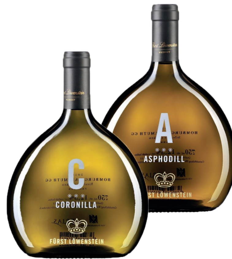
Fürst zu Löwenstein