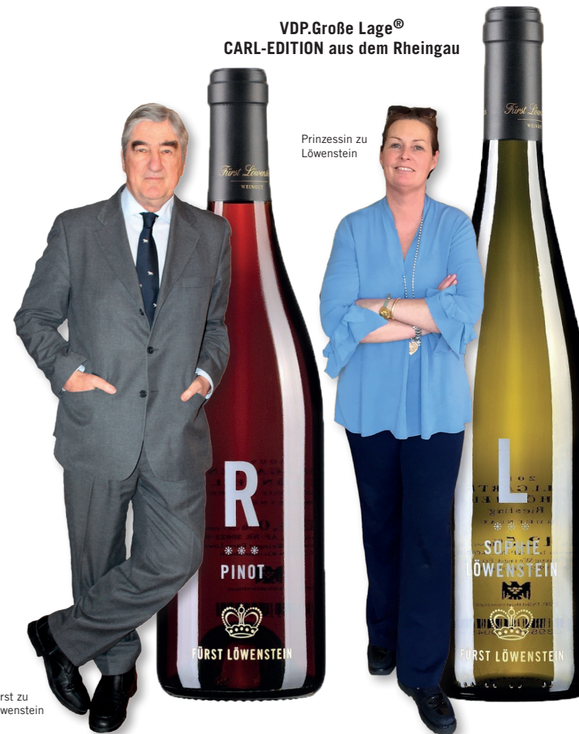
Prinzessin zu Löwenstein